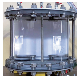
水が透明になり、内部の水が完全に入れ替わりました。