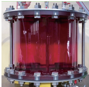
食用紅で着色した水を満たし、透明な水を流し込んでいきます。